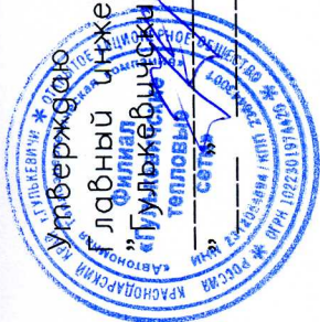
Схема наружных тепловых сетей котельной № 7 г. Гулякевичи, ул. Кирова, 78